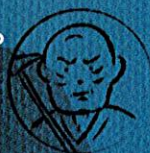
角倉了以 Suminokura Ryoi

保津川下りの歴史は江戸時代の慶長11年(1606年)に始まり、丹波地方で産出された物資(農作物など)を京都へ運ぶため、商人・角倉了以(すみのくらりょうい)が保津川の航路を開削したことに由来する。