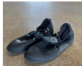
Available for rental